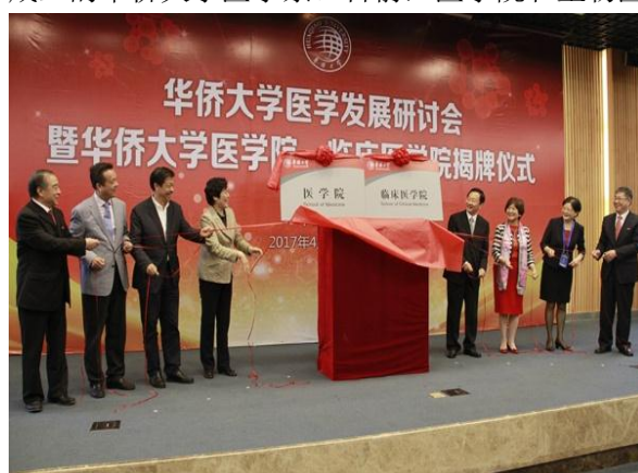
图为医学院揭牌仪式

华侨大学医学院成立于 2017 年 4 月，生物医学学院成立于 2012 年 4 月，二者前身为 1962 年成立的华侨大学医学系。目前，医学院和生物医学学院合署办公。