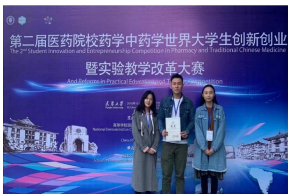
图为药学专业学生参加第二届医药院校药学中药学世界大学生创新创业大赛获得国际组二等奖

培养具有国际化视野，满足海内外社会发展需要，能够在药品研究、开发、生产、检验、流通和使用领域从事研发、生产、鉴定、管理、监督、临床合理用药和新药临床评价等工作，具有创新能力的实用性高素质药学人才。