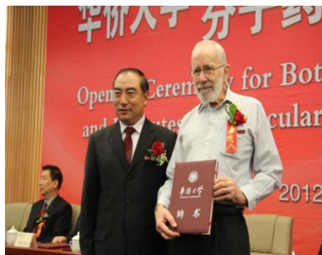
图为 2005 诺贝尔生理医学奖得主 J•Robin Warren 受聘学院名誉教授

★拥有华侨大学附属海峡医院（三级甲等）、华侨大学附属德化医院、晋江市医院等多家附属或教学医院。