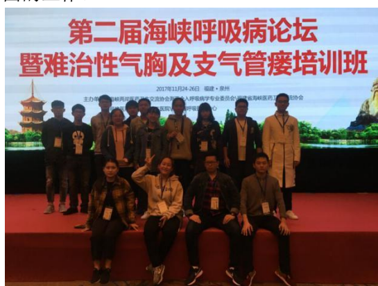
图为临床医学专业学生应邀参加第二届海峡呼吸病论坛

■ 临床医学专业，五年制，医学学士学位： 培养学生具备广博的理工人文知识、坚实的医学基础理论、扎实的临床实践技能，并具有国际化视野、积极面对中国医疗体制的巨大变革和需求，能胜任医学相关领域的临床医疗、疾病预防、科学研究、医学教学及医政管理等方面的工作。