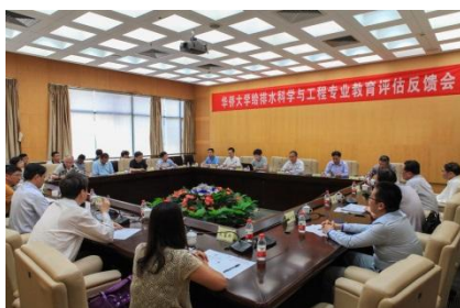
2016年给排水科学与工程通过住建部专业评估