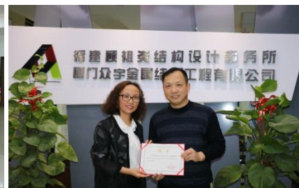
聘请专家担任校外指导教师