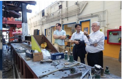
教师访问 Berkeley 大学交流