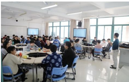
翻转课堂智慧创新教学模式