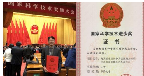
郭子雄教授荣获 2017 年国家科技进步二等奖