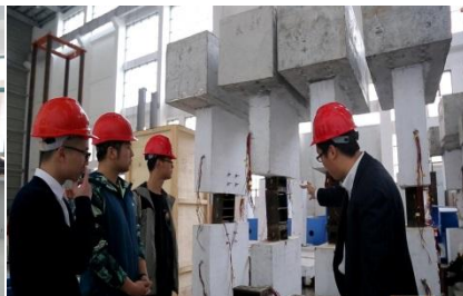
“科教融合”创新教学模式