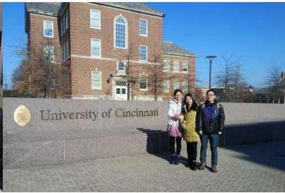
在校学生赴美国辛辛 那提大学交流