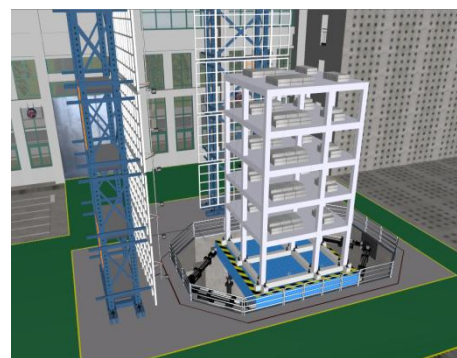
MTS 三向六自由度地震模拟振动台（5m × 5m）