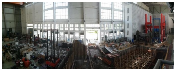
土木工程学科实验大楼结构实验大厅全景