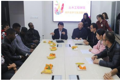
在校外国留学生及港澳学生 学习座谈会