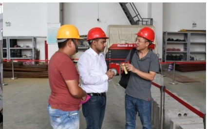
香港理工大学博士来院学习