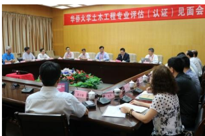
2017年土木工程通过住建部专业评估/认证（复评）

培养德智体美全面发展，在水的开采、加工、输送、回收与再利用这一可持续发展的社会循环中，能在政府部门、规划部门、经济管理部门、环保部门、设计单位、工矿企业、科研单位、大中专院校等部门从事水工艺与规划、设计、施工、运营、教育和研究开发等方面工作的高级应用型技术人才。