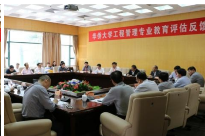
2015年工程管理通过住建部专业评估（复评）