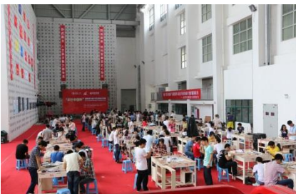
承办福建省大学生结构 设计竞赛