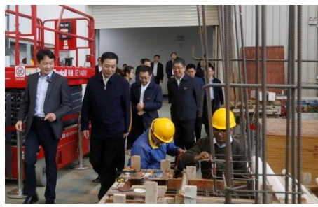
福建省副省长杨贤金视察实验室