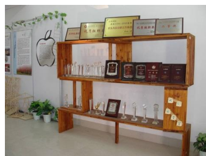
部分全国性大学生科创竞赛 获奖一览