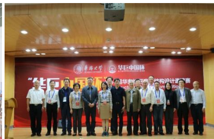
承办华东地区大学生结构 设计竞赛