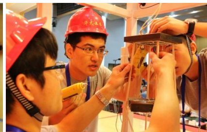
学生在大学生结构设计 竞赛中进行模型加载