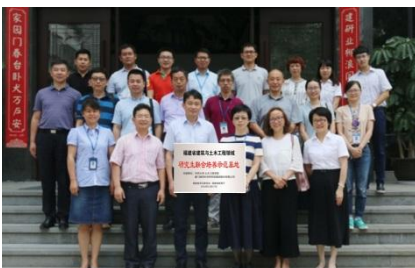
省级研究生联合培养示范基地