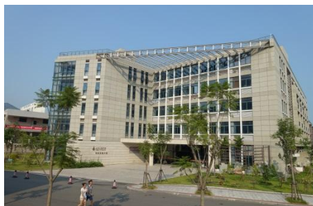
土木工程学科实验大楼外观

华侨大学土木工程系创办于 1964 年。2004 年根据学科发展需要成立土木工程学院，2005 年土木工程学院成建制迁入厦门校区。学院于 1982 年始招收结构工程学科硕士研究生（1986 获硕士学位授予权）；2003 年获结构工程学科博士学位授予权；2018 年获土木工程一级学科博士学位授予权。土木工程学科为福建省特色重点学科和福建省“双一流”建设学科，工程学科进入世界 ESI 排名前 1%。