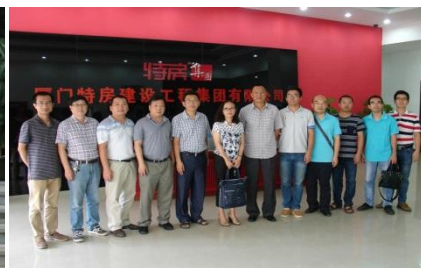
省级大学生校外实践基地